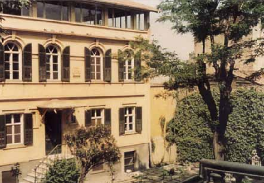
Figur 3. Dragomanhuset på det svenska generalkonsulatets tomt i Istanbul. Bilden togs sommaren 1974, kort efter det att huset överlätts till SFII. På den tidigare inglasade takterrassen finns sedan 1999 en direktörsbostad.

honorärattaché och dragoman, sedan som förste legationssekreterare. Han var där mellan åren 1917 och 1931, mitt i händelsernas centrum, då det osmanska riket drog sin sista suck och en ny turkisk nation tog form. Han dansade med prinsessor från sultanens hov, samtidigt som han följde den turkiska frihetskampen på nära håll och försåg svenska utrikesdepartementet med ingående rapporter om dess framryckning under Mustafa Kemals ledning.