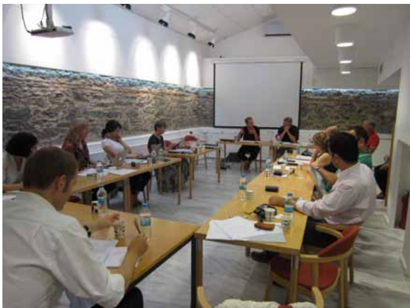
Figur 4. Workshop vid SFII 26–27 juni 2014, på temat National Identity versus Transnationalism: Turkey and Eurasia med deltagare från ett tiotal länder i Europa och Asien. Organistör var det nordiska nätverket MICS.

projektet är utgrävningarna i Labraunda, en kultplats för ”Zeus med dubbelyxan (labrys)” i det antika Karien (sydvästra Turkiet) några århundraden före vår tideräkning. Grävningarna inleddes på privat basis av svenska arkeologer redan 1948, långt innan det fanns något institut i Istanbul. Nu drivs de som ett delat fransk-svenskt projekt med vetenskapligt stöd från bland andra Institut Français d’Études Anatoliennes i Istanbul och Uppsala Universitet. Projektet har en egen publikationsserie och håller varje år en Labraunda-dag vid SFII/Istanbul. Andra pågående eller nyligen avslutade historiska projekt har handlat om gudsbilden i 300-talets bysantinska Kappadokien, arkitektoniskt symbolspråk från tidig-bysantinsk tid, osmansk arkitektur och Karl XII:s maktutövning över Sverige under åren i Osmanska