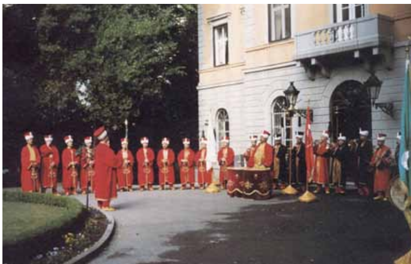
Figur 2. Osmansk militärmusik framför Palais de Suède, Istanbul, den 5 juni 1999. Tarihî Türk Müziği Topluluğu Mehter Bölümü, T.C. Kültür Bakanlığı.

logen Gustav H. Karlsson som sekreterare. Till en början bestod det nya forskningsinstitutet av inte stort mer än stadgar och donerade medel för stipendier och resebidrag. Verksamheten skulle komma att ta riktig fart, sedan institutet fått tillgång till egna lokaler 1974 och i likhet med de andra två Medelhavsinstituterna beviljats ett årligt bidrag från staten från och med 1976.